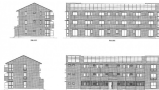
完成予想図につき実際とは多少異なる場合があります。